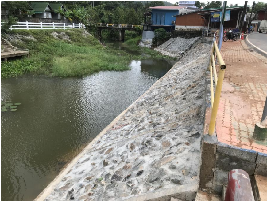
ล้างท่อระบายน้ำในตำบลเกวียนหัก